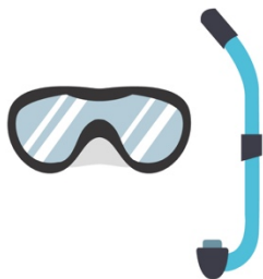
Un masque de plongée et un tuba