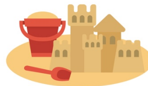
Un château de sable