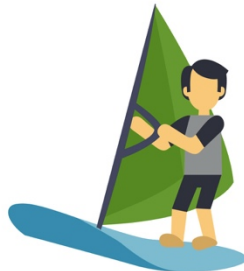
Une planche à voile