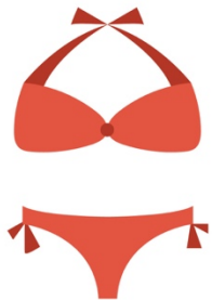
Un maillot de bain