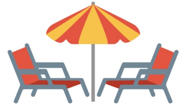
Des chaises et un parasol