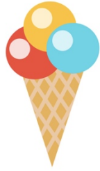
Un cornet de glace