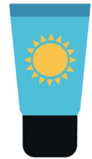
De la crème solaire