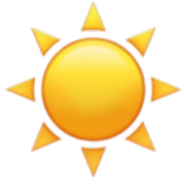
Le soleil Il fait beau / c'est ensoleillé