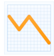
Les températures baissent