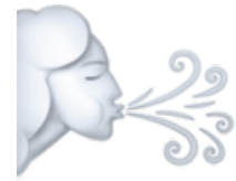
Le vent Le vent souffle / il vente