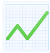
Les températures augmentent