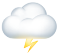
Un orage Il fait orageux