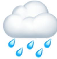
La pluie Il pleut / c'est pluvieux