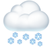
La neige Il neige / c'est neigeux