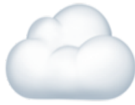
Un nuage Il fait / c'est nuageux