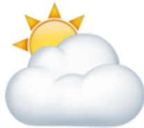
Le ciel est couvert