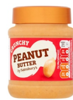
17. Du beurre de cacahouètes