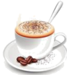
3. Un chocolat