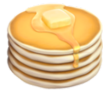
9. Des pancakes