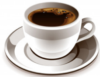
2. Un café