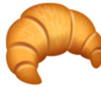
8. Un croissant