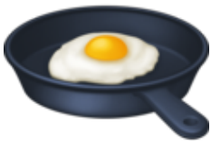
10. Un œuf