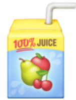
5. Un jus de fruits