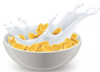
12. Des céréales