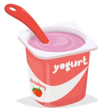
11. Un yaourt