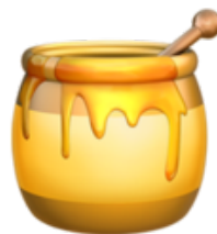
16. Du miel