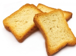
20. Des biscottes