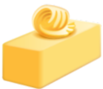
14. Du beurre