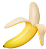
13. Une banane