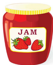
15. De la confiture