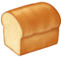
6. Du pain de mie