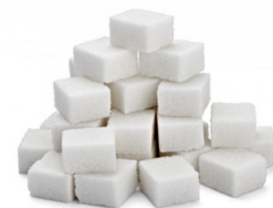
21. Du sucre