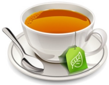
1. Un thé