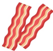
19. Du bacon