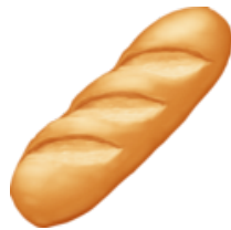
7. Une baguette