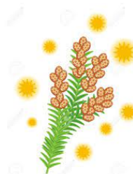
15. le pollen