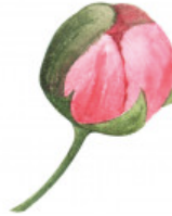
11. le bourgeon