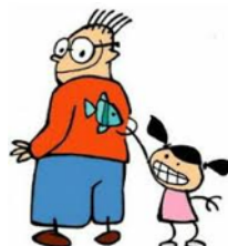
19. poisson d'avril