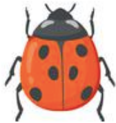
10. la coccinelle