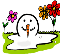
7. la neige fond