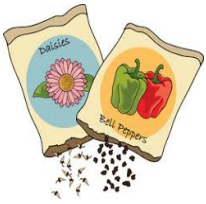
9. les semences