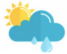
4. le temps changeant