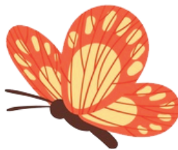
14. le papillon