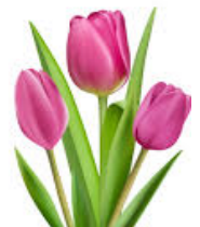
20. les tulipes