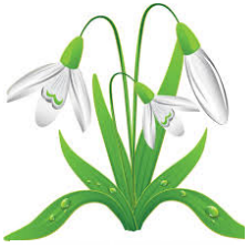
1. le perce-neige