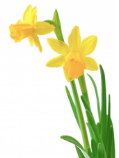
16. les jonquilles