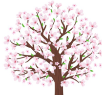
2. l'arbre fleuri