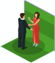
5. Les comédiens