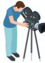
3. Le directeur de la photographie