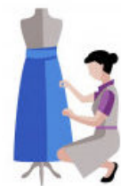
16. La costumière