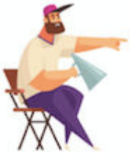
1. Le réalisateur