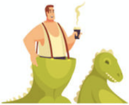
9. La doublure