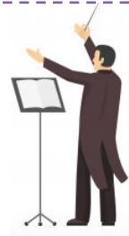
15. Le compositeur