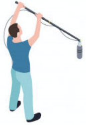
4. L'ingénieur du son