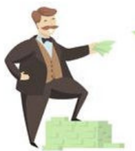
14. Le producteur