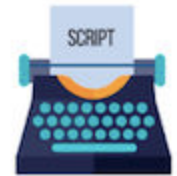
12. Le scénariste