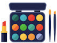
13. Le maquilleur